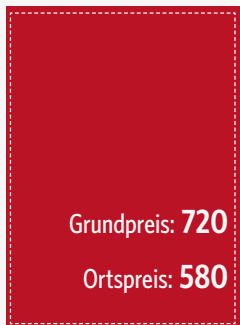
U3 105 x 148 mm (zzgl. 3 mm umlaufend)