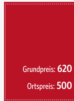
1/1 Seite 105 x 148 mm (zzgl. 3 mm umlaufend)