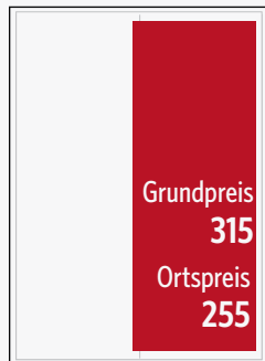
1/2 Seite hoch 45 x 130 mm