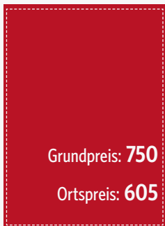
U2 105 x 148 mm (zzgl. 3 mm umlaufend)