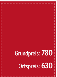
U4 105 x 148 mm (zzgl. 3 mm umlaufend)

* Bei Auftragserteilung über Werbemittler erfolgt die Annahme und Berechnung von Anzeigen- und Beilagenaufträgen zu den jeweiligen Grundpreisen. Das gleiche gilt auch für Kunden, die ihre Rechnungsanschrift außerhalb des Verbreitungsgebietes haben.