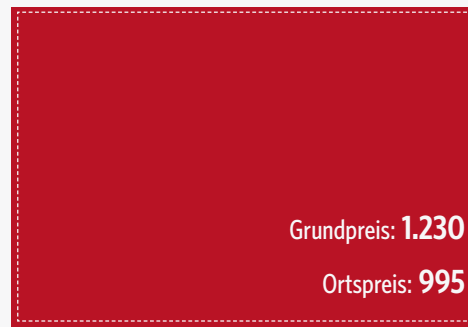
Doppelseite 210 x 148 mm (zzgl. 3 mm umlaufend)