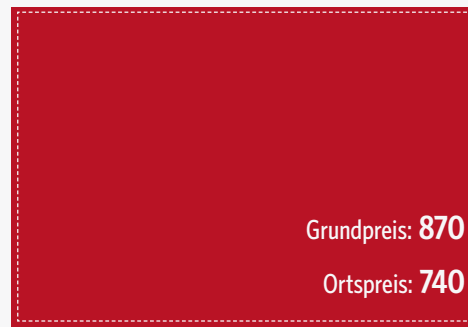
Doppelseite 210 x 148 mm (zzgl. 3 mm umlaufend)