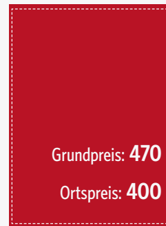
1/1 Seite 105 x 148 mm (zzgl. 3 mm umlaufend)