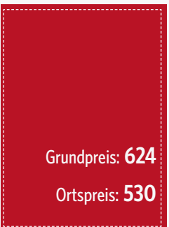
U4 105 x 148 mm (zzgl. 3 mm umlaufend)

* Bei Auftragserteilung über Werbemittler erfolgt die Annahme und Berechnung von Anzeigen- und Beilagenaufträgen zu den jeweiligen Grundpreisen. Das gleiche gilt auch für Kunden, die ihre Rechnungsanschrift außerhalb des Verbreitungsgebietes haben.