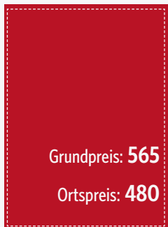
U3 105 x 148 mm (zzgl. 3 mm umlaufend)