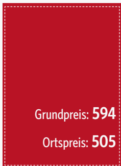
U2 105 x 148 mm (zzgl. 3 mm umlaufend)