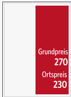
1/2 Seite hoch 45 x 130 mm